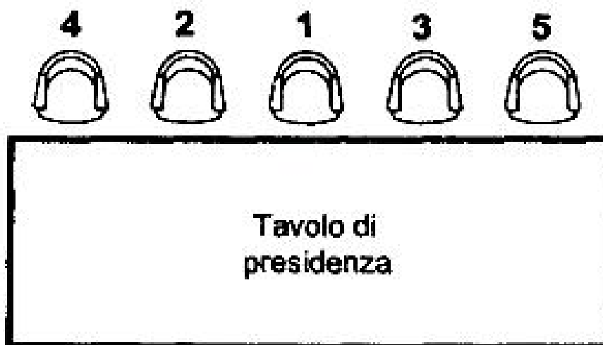
Figura 1: Disposizione dei posti in un tavolo di Presidenza

Fra due posti a sedere vicini, il posto d'onore è quello di destra (si intende per chi siede, e cioè il sinistro per chi guarda di fronte). Fra tre posti quello d'onore è nel mezzo, il secondo è alla destra di chi siede, ed il terzo è a sinistra. E via proseguendo (Fig. 1)