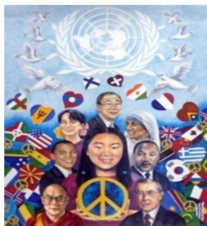
Vincitore del primo premio "Immagina la Pace" 2012-13

Anche quest'anno, il LIONS CLUB FORLÌ HOST è orgoglioso di sponsorizzare e sostenere, presso le scuole medie di Forlì e i gruppi giovanili, l'iniziativa Lions International "UN POSTER PER LA PACE", concorso artistico per bambini, giunto quest'anno alla sua 26ª edizione. Trattasi – come è noto – di un concorso che incoraggia i giovani di tutto il mondo ad esprimere la loro visione della pace, coinvolgendo ogni anno nel mondo oltre quattro milioni di bambini di età compresa tra gli 11 e i 13 anni, provenienti da quasi 100 paesi. Il tema per l'anno 2013/14 è "Il nostro mondo, il nostro futuro".