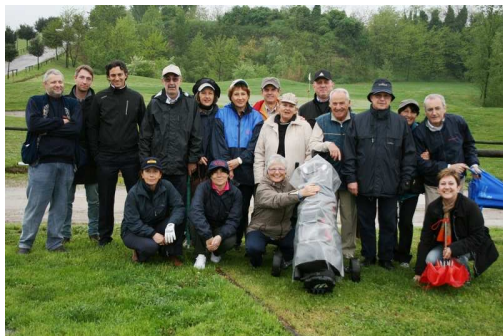
Un gruppo di coraggiosi incuranti delle intemperie

Tutti i giocatori hanno partecipato anche alla gara di putting green che aveva lo scopo finale di raccogliere fondi per il nostro service a favore dell'A.V.A.; complessivamente il risultato economico è stato più che soddisfacente.