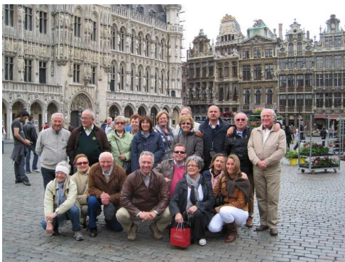
Foto di gruppo della spedizione

Particolarmente riuscita la visita agli amici di Mont St. Guibert che ci hanno saputo accogliere con grande affetto e profondo senso di amicizia. Ci hanno "preso in consegna" all'arrivo e ci sono stati vicini in ogni momento formale e ludico, ci hanno condotto nelle loro case e hanno reso possibile la nostra escursione extra a Brussel. La gioia